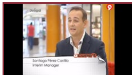
Entrevista Canal 9.