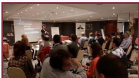
Evento 18-19 Abril.2013